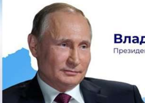
Владимир Путин Президент Российской Федерации

ПРЕЗИДЕНТ РОССИЙСКОЙ ФЕДЕРАЦИИ Vladimir Putin